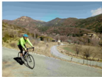
La Drômoise en Baronnies