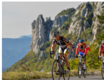
La Drômoise en Vercors