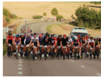
La Drômoise Classique